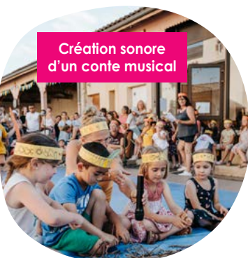
Création sonore d'un conte musical