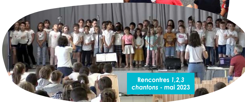
Rencontres 1,2,3 chantons - mai 2023