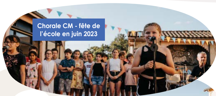
Chorale CM - fête de l'école en juin 2023